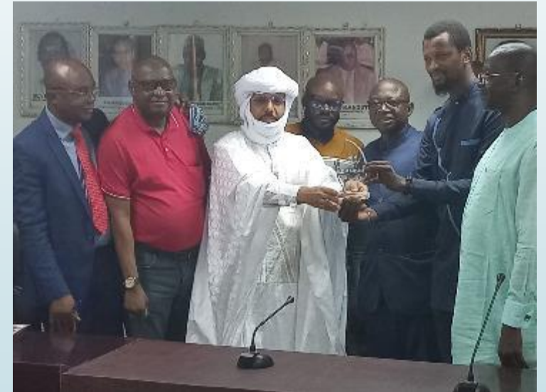
Salon international du recrutement au Mali : L'ANPE reçoit le trophée du meilleur partenaire public